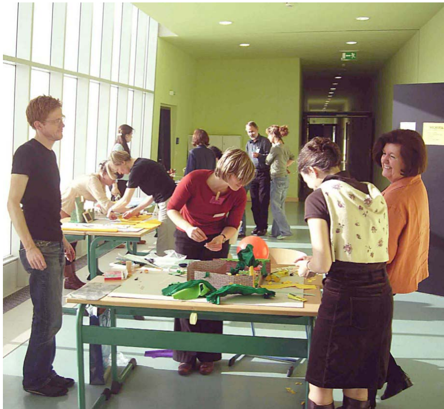
Unterschiedlichste Menschen miteinander im Gespräch – lachend und werkend: Eine typische Szene aus einer Zukunftswerkstatt zur Stadtplanung mit Anwohnerinnen und Anwohnern. (Aachen 2005)

Zwei Merkmale fallen denjenigen Menschen, die an einer Zukunftswerkstatt teilnehmen, zuerst ins Auge: zum einen der dreiphasige Aufbau Kritik – Utopie – Realisierung, zum anderen das Fehlen von Diskussionen. An die Stelle üblicher Gruppendiskussionen treten Stichwörter, die offen aufgeschrieben und schrittweise konkretisiert werden, sowie Kreativität fördernde Verfahren und Spiele, Planungstechniken und ähnliches.